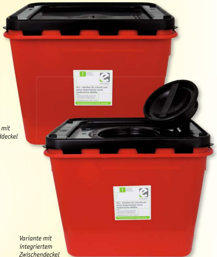
Variante mit Standarddeckel

für einen festen Stand zum Kleben oder Schrauben auf eine feste Oberfläche. Bei Behältererstbestellung ist eine Behälterbefestigung im Setpreis enthalten.