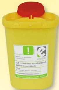
0,7 L – Behälter für scharfe und spitze Gegenstände