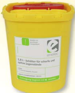
1,8 L – Behälter für scharfe und spitze Gegenstände