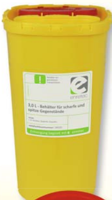
3,0 L – Behälter für scharfe und spitze Gegenstände